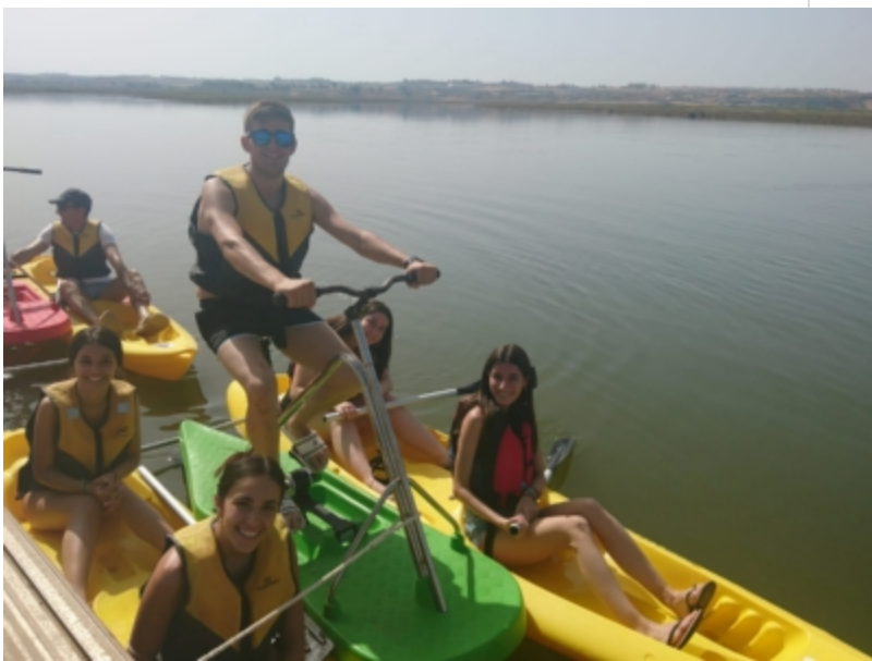
( http://www.canavaldeleon.es/es/.galleries/imagenes-noticias/294549734_2228894687284588_4714824377921994275_n.jpeg )