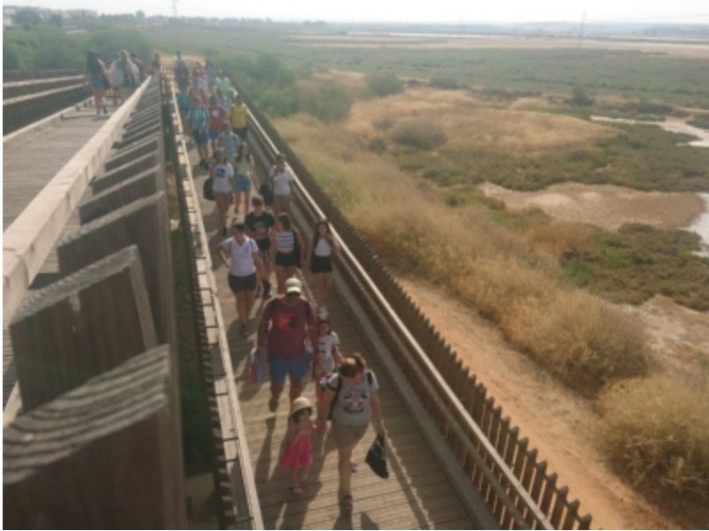
( http://www.canavaldeleon.es/es/.galleries/imagenes-noticias/294899450_2228879133952810_5147842842529565919_n.jpeg )