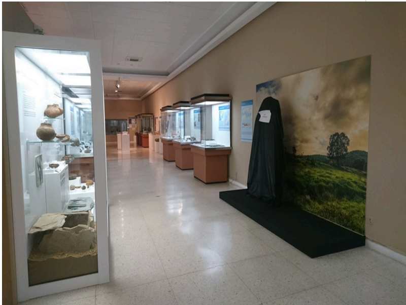
( http://www.canaveraldeleon.es/export/sites/canaveral/es/ayuntamiento/sala-de-prensa/.galleries/Noticias/museo-2.jpg )