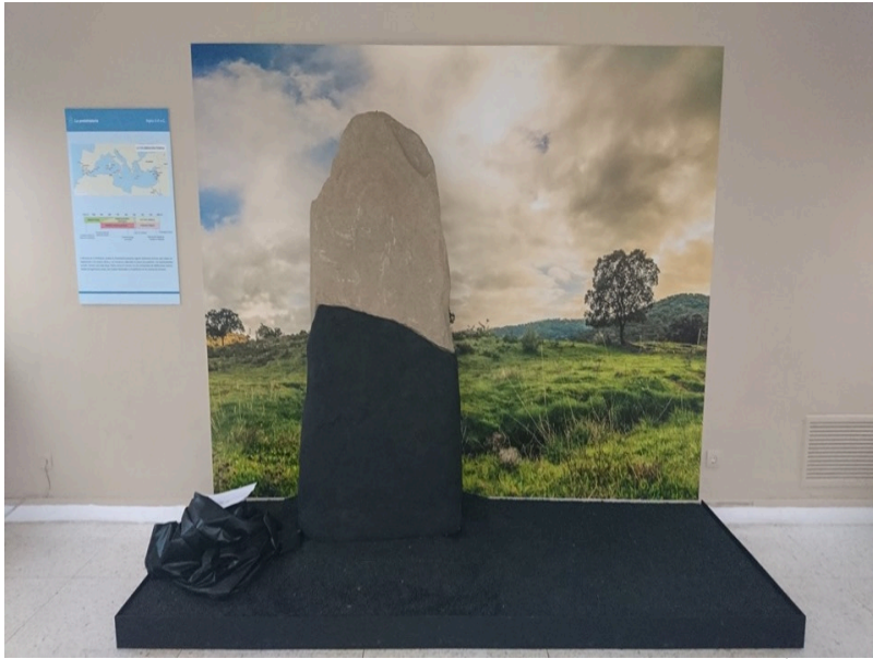
( http://www.canaveraldeleon.es/export/sites/canaveral/es/ayuntamiento/sala-de-prensa/.galleries/Noticias/museo-3.jpg )