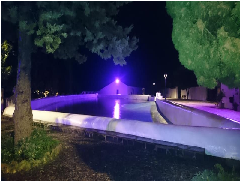
( http://www.canavaldeleon.es/export/sites/canaval/es/ayuntamiento/sala-de-prensa/.galleries/Noticias/127926759_1758430564331005_7317 )