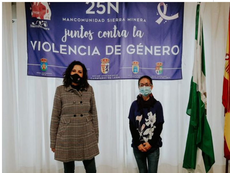
( http://www.canavaldeleon.es/export/sites/canaval/es/ayuntamiento/sala-de-prensa/.galleries/Noticias/127263014_1755535881287140_5271 )